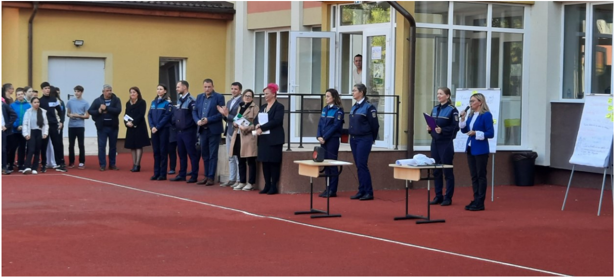
Lansarea proiectului, „Ia atitudine, spune nu violenței” în colaborare cu I.J.P. Bistrița și I.S.J Bistrița-Năsăud.